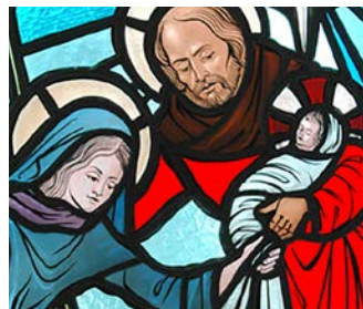
Et barn er oss født side 6