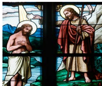
Veirydderen døperen Johannes, side 5