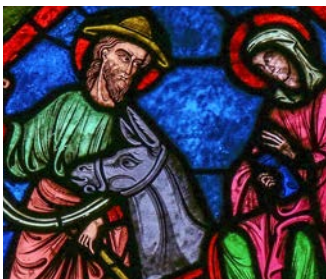
Josefs jul side 3