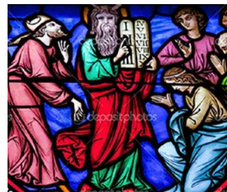
Guds ti bud side 14