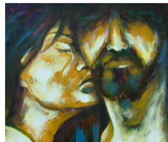
Arvesynden side 12