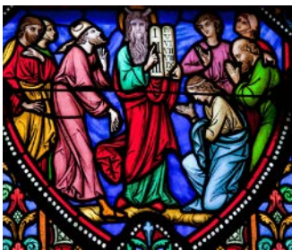
Det største bud – den største kjærlighet, side 5