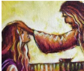
Nåde – fra begynnelse til ende, side 8