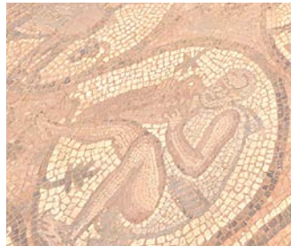
Abrahams tro og hva den virket, side 10